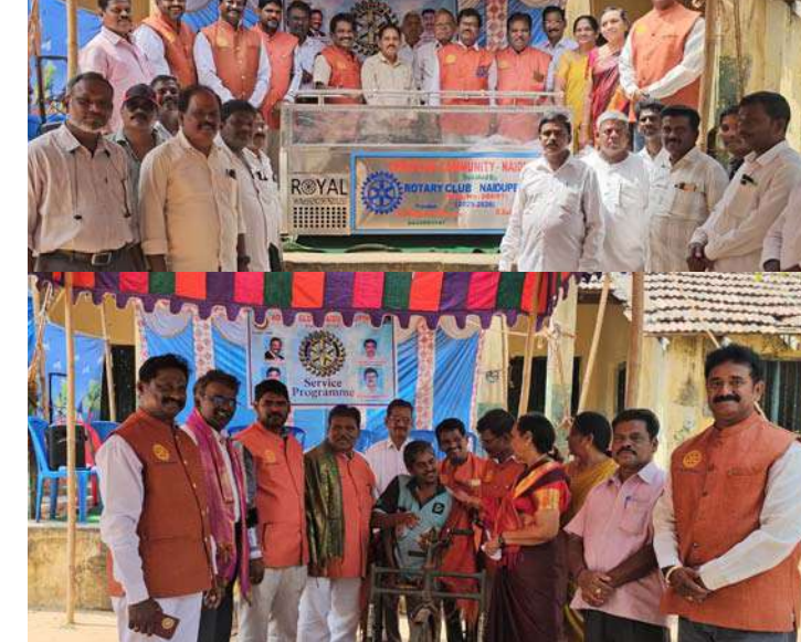
స్వర్ణ సాగరం (నాయుడుపేట) ఏప్రిల్ 04.