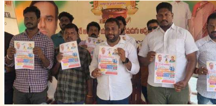
కోవూరు, స్వర్ణ సాగరం, ఏప్రిల్ 4: