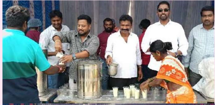
బంగారుపాళ్ళం, స్వర్ణసాగరం, ఏప్రిల్ 4